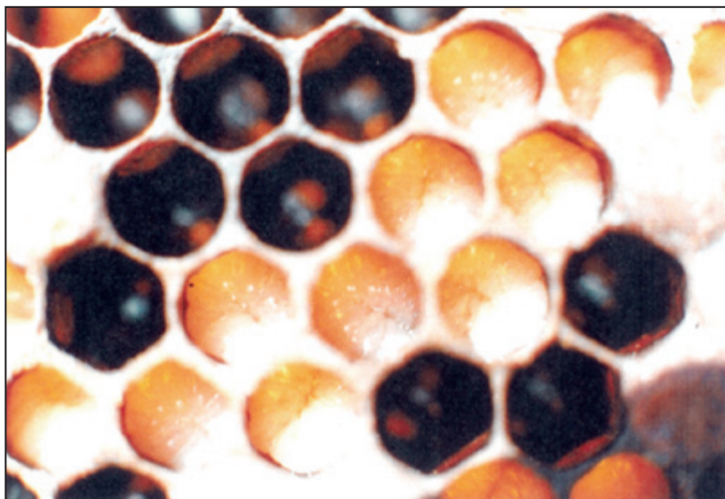
شکل ۲- محدوده در نظر گرفته شده شامل لاروهای سن آخر

سر بسته شدن سلول ها، قاب های مورد نظر از کندو خارج و عاری از زنبور گشتند و به انکوباتور بزرگ انتقال یافتند. در تمام طول آزمایش ها درجه حرارت انکوباتور 34 \pm 1 درجه سانتیگراد و رطوبت نسبی ۴۰ تا ۶۰ درصد تنظیم گردید. هر دو ساعت یکبار به قاب ها سر زده شد و تعداد سلول های باز شده و زمان دقیق باز شدن آنها یادداشت گردید و تا آخرین سلول ها ادامه یافت. زنبورهای متولد