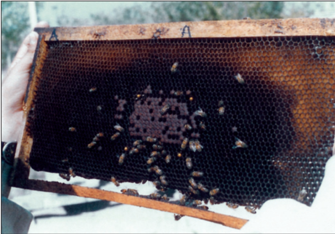
شکل ۳- بسته شدن تمام سلول‌های هم سن در یک زمان در قسمت در نظر گرفته شده

بین میانگین‌ها مشاهد نشد. مقایسه میانگین‌ها با آزمون دانکن هم نشان می‌دهد که همه تیمارها در یک گروه مشخص (a) قرار می‌گیرند و تفاوت معنی‌داری نشان نمی‌دهند.