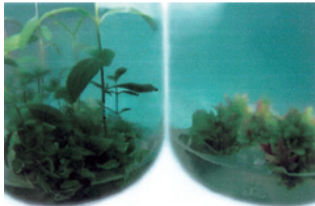
شکل ۱- اثر هورمون‌های مختلف بر شاخه‌زایی و شاخص سبزیگی کشت درون شیشه‌ای گونه E. melliodora (سمت راست BAP به تنهایی و چپ 1 میلی‌گرم در لیتر BAP و 0.5 میلی‌گرم در لیتر)

بررسی اثر تنظیم کننده‌های رشد بر رشد طولی شاخه‌ها و تعداد جوانه‌ها، سبزیگی، تعداد شاخه، وزن تر شاخه‌های ایجاد شده و ریشه‌زایی شاخه‌های E. melliodora نشان داد که هر یک از این عوامل به یک نوع تنظیم کننده رشد پاسخ بهتری نشان می‌دهند. بررسی اثر سیتوکینین‌ها بر رشد طولی شاخه‌های ایجاد شده از قطعات میان‌گره دانه‌رسته‌های E. melliodora نشان داد که شاخه‌های به دست آمده از محیط MS حاوی 0.1 میلی‌گرم در لیتر BAP و 0.5 میلی‌گرم در لیتر 2iP بیشترین میزان رشد طولی را داشتند که نشان دهنده اثر مثبت