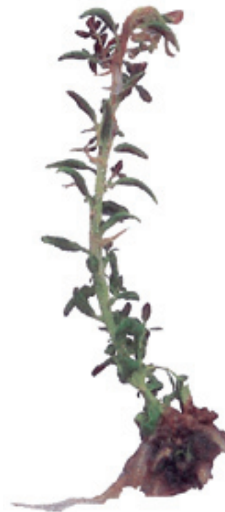
شکل ۲- نمونه دارای کالوس قاعده‌ای و ریشه هوایی

بررسی شاخه‌های انتقال یافته به محیط‌های ریشه‌زایی نشان داد که بهترین تیمار از نظر ایجاد ریشه‌های طبیعی ۰/۱ میلی‌گرم در لیتر NAA بود و افزایش غلظت NAA موجب افزایش میزان تشکیل کالوس قاعده‌های شد. تشکیل کالوس قاعده‌های با کاربرد NAA توسط Razman Khan (۸) روی Olea europaea L. نیز گزارش شده است. در حضور D - ۴، ۲ ریشه‌های ضعیفی تشکیل شد، با این وجود غلظت‌های پایین‌تر D - ۴، ۲ اثر بهتری داشتند. با افزایش غلظت D - ۴، ۲ میزان تشکیل ریشه کاهش اما میزان کالوس قاعده‌ای افزایش یافت. در این پژوهش، در محیط بدون هورمون همه ریشه‌ها در داخل محیط قرار می‌گرفتند و بر روی قسمت‌های جانبی ساقه ریشه‌ای تشکیل نشد. بعلاوه فراوانی تشکیل کالوس‌های