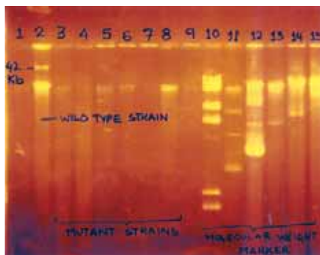
شکل ۳- تایید وجود پلاسمید در سویه های وحشی لاکتوسین RN ۷۸ و غیاب آن در کلنی های تیمار شده

۳. این نتایج نشان می دهد که تولید لاکتوسین RN ۷۸ توسط L.acidophilus RN ۷۸ مربوط به پلاسمید می باشد. چندین چنین گزارش نیز ، تولید باکتریوسین توام با پلاسمید را در باکتری های لاکتیک اسید نشان داده اند (۲۷،۹).