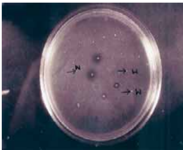
شکل ۲- اثر ضد باکتریایی باکتریوسین RN ۷۸ بر علیه باکتریهای اندیکاتور پس از تیمار شدن