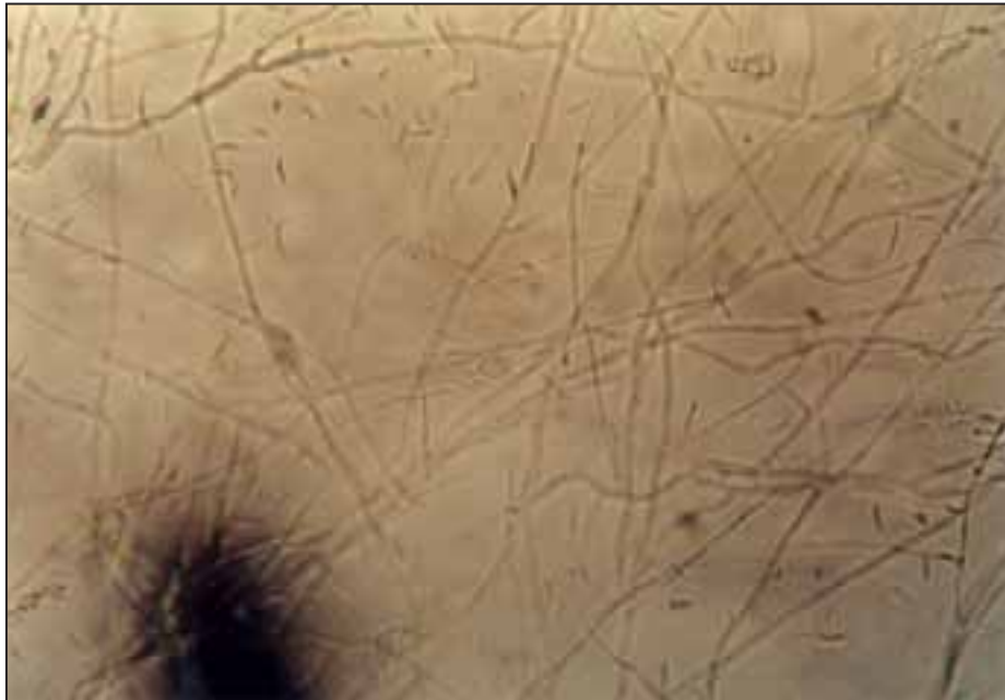
تصویر شماره ۱ - اسلاید کالچر قارچ A. robusta جدا شده از مدفوع گوسفند (بزرگنمایی ۱۰۰×)