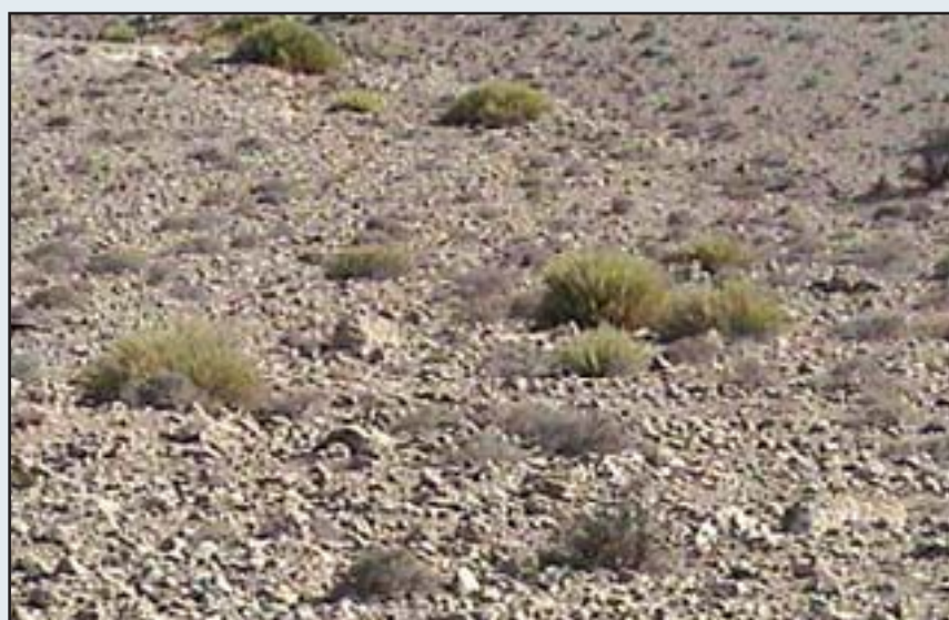
جامعه Chrysopogono aucheri- Convolvuletum spinosae

a letude de la flore et de la vegetation des Deserts d , Iran, Etude la vegetation analysis Phytosociologique et Phytochorologique des Groupements vegetaux , Fasc.10, 2vols, Meise. 454P.