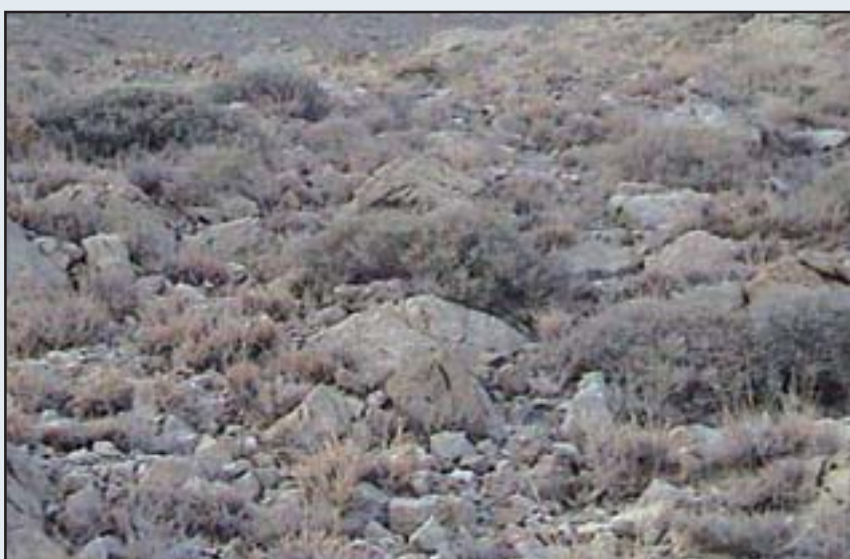
جامعه Chrysopogono aucheri- Convolvuletum spinosae

منطقه با اصول و مبانی مدیریتی لازم برای یک منطقه حفاظت شده مغایرت دارد.