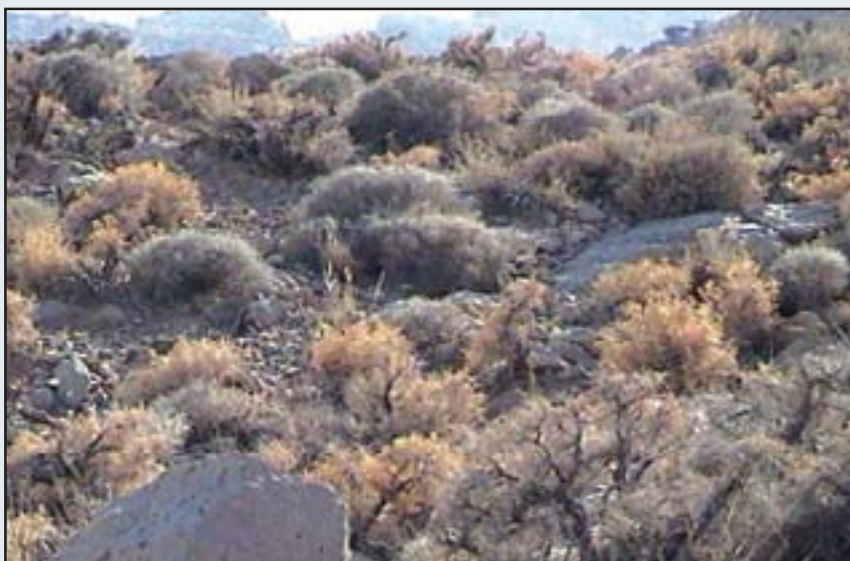
جامعه Cousinio stocksii - Convolvuletum spinosae