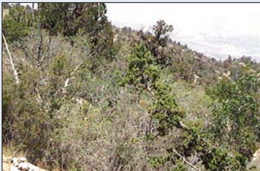
جامعه Juniperetum excelsae - ceri monspessulani