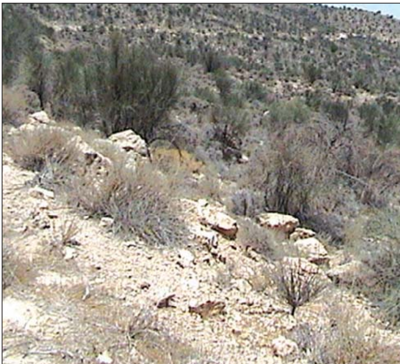
جامعه Ebeno stellatae – Amygdaletum scopariae

National Academy of Science , Washangton.Dc.