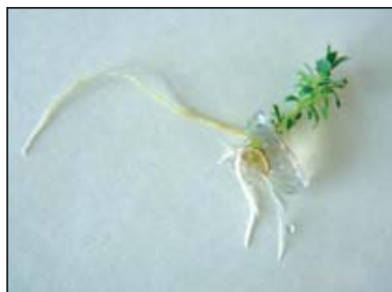
شکل ۲: ریشه‌زایی شاخه‌های بدست آمده

درصد ریشه‌زایی شاخه‌های بدست آمده در تیمارهای مختلف محیط کشت (جدول ۲)، نشان داده که بالاترین درصد ریشه‌زایی (شکل ۲) در تیمارهای محیط کشتی از تیمار ۱۲ (MS) ¼، همراه با ¼ شکر، ¼ نیترات، (IBA ۰/۵ mg/l) بدست آمد.