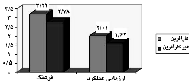
شکل ۲ مقایسه نظام ارزیابی عملکرد و ابعاد فرهنگی شرکت‌های کارآفرین و غیر کارآفرین