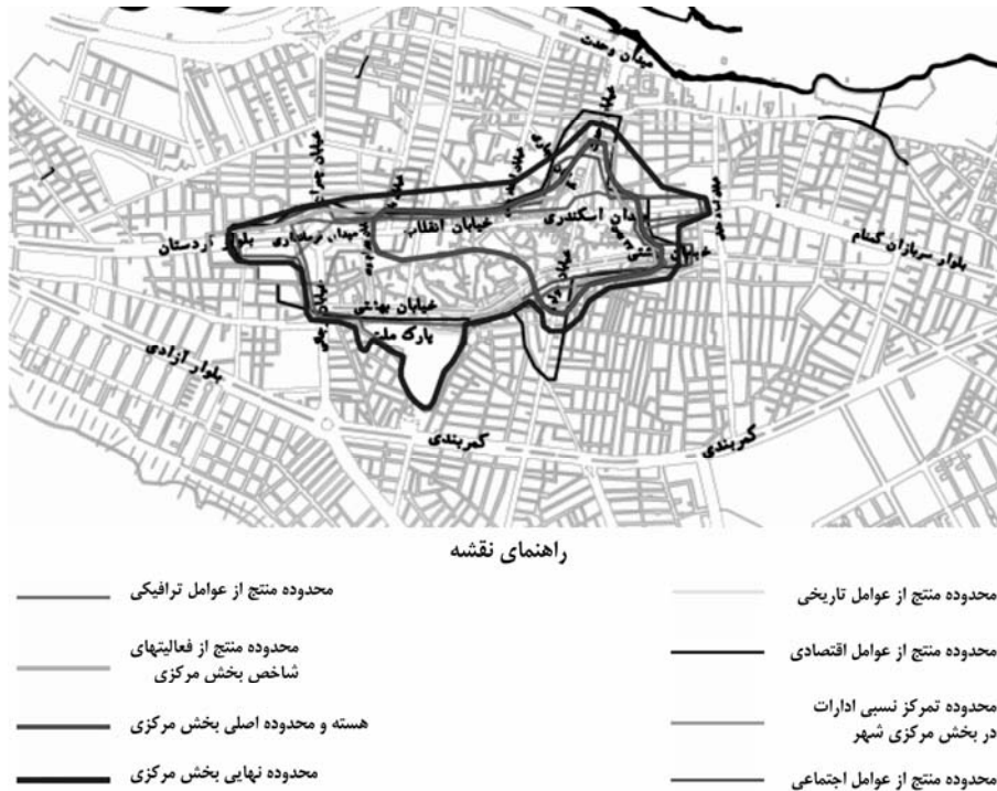
شکل ۱۱ نقشه محدوده بخش مرکزی شهر بوکان بر اساس عوامل شش‌گانه

محدوده بخش مرکزی شهر بوکان: بر اساس مجموعه شاخصها هسته اصلی بخش مرکزی شهر بوکان شامل محدوده‌ای است که منطبق بر محدوده بازار شهر می‌باشد. محدوده‌ای که شامل خیابان انقلاب از میدان اسکندری تا خیابان کمالی، خیابان مولوی حد فاصل خیابان بهشتی تا خیابان انقلاب، بدنه میدان اسکندری، خیابان ۲۲ بهمن، بخشهایی از خیابان نجاری و وحدت، کوچه ضلع جنوبی خیابان مولوی که از نظر بسیاری از شاخصها تفاوت اساسی با محیط اطراف خود دارد، می‌شود. وضعیت شاخصهای مختلف نشان می‌دهد که با دور شدن تدریجی از محدوده یاد شده به تدریج از تمرکز و تراکم فعالیتها کاسته می‌شود. بنابراین بر اساس مجموعه شاخصها