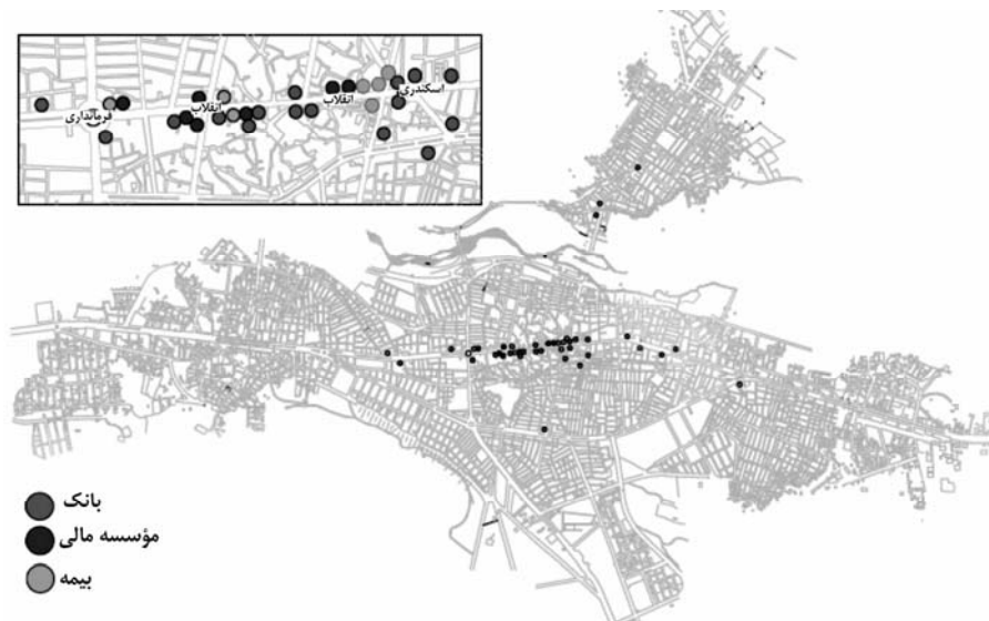
شکل ۴ نقشه پراکندگی بانکها، مؤسسات مالی و بیمه

تمرکز فعالیت‌های مهم و برتر شهر بوکان در محدوده‌های مشخصی از آن به صورت بارز و مشهود نمایان است. محدوده بازار به عنوان رکن اصلی فعالیت‌های اقتصادی مهم شهر از نظر سایر ویژگی‌ها همانند قیمت زمین، تمرکز بانکها، مؤسسات مالی و بیمه، و تراکم اشتغال، تفاوت بارزی را با سایر قسمتهای شهر نشان می‌دهد.