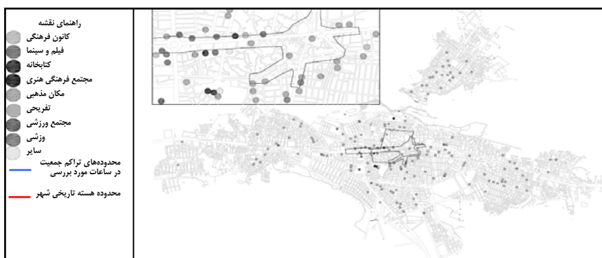
شکل ۵ نقشه پراکندگی فعالیتهای فرهنگی و محدوده تراکم جمعیت در ساعات خاصی از روز

شاخصهای اجتماعی: در بررسی عوامل اجتماعی مشخص شد که محدوده‌های اولیه توسعه شهر بوکان در ساعات خاصی از روز (۹/۵ تا ۱۱/۵ صبح و ۴/۵ تا ۶/۵ بعدازظهر) نسبت به سایر قسمت‌های شهر دارای تراکم جمعیت به مراتب بیشتری است. همچنین فضاهای عمومی مهم شهر در این محدوده‌ها واقع شده‌اند که به صورت کانون برگزاری مراسم اجتماعی شهر عمل می‌کنند. یافته‌ها همچنین نشان داد که مراکز فرهنگی برتر شهر (۸۵ درصد فعالیتهای فرهنگی همانند کانونهای فرهنگی، کتابخانه، فیلم و سینما و ...) و بخش اعظم فعالیتهای پذیرایی شهر (۶۰ درصد از کل فعالیتهای پذیرایی شهر) در محدوده‌های اولیه شهر و به ویژه در هسته اصلی شهر قرار دارند که در شکل‌های ۵ و ۶ نشان داده شده‌اند.