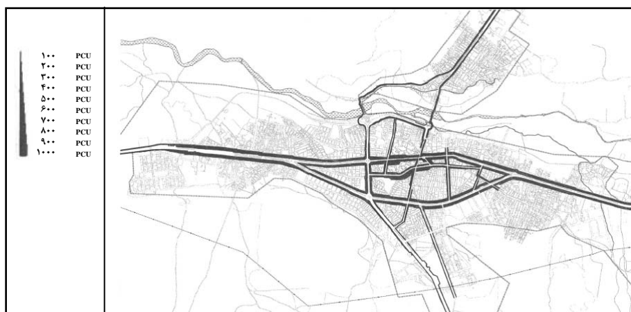
شکل ۸ نقشه حجم حمل و نقل در سطح شهر بوکان به PCU

عوامل ترافیکی تحت تأثیر سایر عوامل شکل می‌گیرند و در ارتباط مستقیم با سایر عوامل عمل می‌کنند و خود نیز سایر عوامل را تحت تأثیر قرار می‌دهند. بررسی شاخصهای منتج از عوامل ترافیکی در سطح شهر بوکان نشان می‌دهد که بیشترین ایستگاههای حمل و نقل درون‌شهری به‌صورتی متراکم در محدوده‌ای کاملاً مشخص (میدان اسکندری، خیابان ۲۲ بهمن تقاطع مولوی - انقلاب و تقاطع مولوی - بهشتی) وجود دارند و محدوده‌های نامبرده کانون جذب و تولید بسیاری از سفرهای درون‌شهری بوکان می‌باشد. بررسی خطوط حمل و نقل عمومی شهر بوکان نشان می‌دهد که این خطوط در ارتباط با سایر عوامل و به‌ویژه در ارتباط با بازار شهر تعیین مسیر شده‌اند و کل محدوده بازار را تحت پوشش قرار می‌دهند.