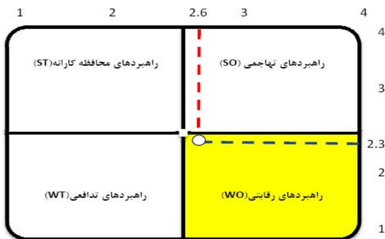
شکل ۵ انتخاب راهبردی توسعهٔ گردشگری مذهبی در منطقهٔ مورد مطالعه

تحلیل SWOT نشان می‌دهد از نظر مردم، عوامل داخلی (قوت‌ها و ضعف‌ها) دارای اهمیتی برابر با ۲/۶ و عوامل خارجی (فرصت‌ها و تهدیدها) دارای اهمیتی معادل ۲/۳ بوده‌اند. به این ترتیب، با عنایت به محور مختصات تهیه‌شده (ر.ک شکل ۵) می‌توان راهبرد رقابتی را برای توسعهٔ گردشگری مذهبی در روستاهای مورد مطالعه براساس رهیافت مردمی پذیرفت.