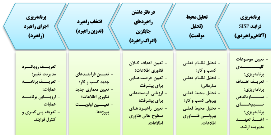
شکل شماره ۱ (۱): فرایند برنامه ریزی نظام اطلاعات راهبردی

برنامه ریزی نظام های اطلاعات راهبردی فرایندی است که از طریق آن، سازمان چارچوبی از برنامه های کاربردی مبتنی بر رایانه را تعیین می کند تا بتواند به این مجموعه از نظام ها برای دستیابی به اهداف راهبردی سازمانی کمک نماید. آر ساب هر وال ۲ و هم کاران (۲۰۰۱)، برنامه ریزی نظام های اطلاعات راهبردی را این گونه تعریف می کنند: فرایند تفکر راهبردی برای مشخص کردن مطلوب ترین نظام اطلاعاتی که سازمان بتواند سیاست ها و فعالیت های بلندمدت فناوری اطلاعاتش را اجرا و تکمیل کند. این فرایند، سازوکاری است برای تضمین هم راستایی فعالیت های فناوری اطلاعات با تکامل راهبردها و نیازهای سازمان. فرایند برنامه ریزی نظام های اطلاعات راهبردی مجموعه ای مشخص از نظام های اطلاعاتی است که می تواند به سازمان در انجام فعالیت های تجاری و دستیابی به اهداف تجاری کمک نماید. بنابراین سازمان ها این برنامه را با هدف تشخیص با ارزش ترین نظام های اطلاعاتی انجام داده و به دنبال برنامه های کاربردی و نظام هایی هستند که نتیجه ای در پشتیبانی از موقعیت رقابتی و ایجاد مزیت رقابتی آنها داشته است (الهی و باقری، ۱۳۸۳).