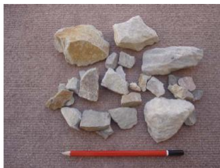
شکل ۱: نمونه مصالح شکسته گوشه‌دار مورد استفاده در نمونه‌ها.