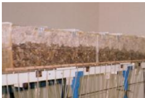
شکل ۵: تصویری از آزمایش روی نمونه S_{4c} با دبی متوسط.