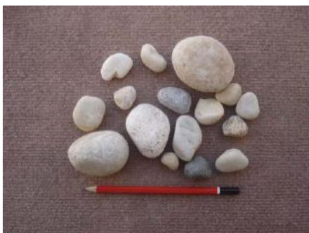
شکل ۲: نمونه مصالح گردگوشه رودخانه‌ای مورد استفاده در نمونه‌ها.