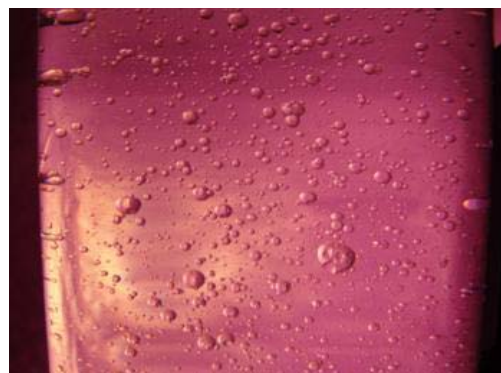
شکل ۲: نمونه‌ای از عکس‌های گرفته شده از قطره‌ها.

برای انجام هر آزمایش، ابتدا دو فاز پراکنده و پیوسته از یکدیگر به طور کامل اشباع شده و سپس ستون از فاز پیوسته پر می‌شود. به کمک پمپ، فاز پراکنده به داخل فاز پیوسته پمپاژ می‌شود. برای مدلسازی ماکزیمم میانگین اندازه قطره‌ها، دو سری آزمایش انجام گرفته است و از نتایج این آزمایش‌ها روابط مورد نظر استخراج شده‌اند. سری اول آزمایش‌ها مربوط به سیستم شیمیایی بوتانول- آب است. قطر داخلی نازل برابر ۱ و ۱/۳ میلی‌متر بوده و در ۶ دبی حجمی مختلف فاز پراکنده و ۳ دبی حجمی مختلف فاز پیوسته، قطر متوسط قطره‌ها و سرعت حد به دست آمده‌اند. بدین ترتیب که در هر دبی حجمی توسط دوربین از قطره‌ها عکسبرداری شده و به کمک نرم‌افزار اتوکد ۱ ، اندازه قطره‌ها به دست آمده و به کمک رابطه (۱) قطر متوسط حجمی- سطحی محاسبه شده است. نمونه‌ای از عکس‌های گرفته شده توسط دوربین عکسبرداری در شکل (۲) آمده است.