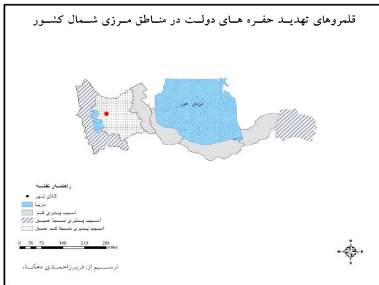
نقشه ۱: حفره‌های دولت در شمال کشور

بنابراین استان‌های آذربایجان غربی و خراسان دارای حفره‌هایی نسبتاً عمیق هستند و استان آذربایجان شرقی دارای حفره‌هایی نسبتاً کم عمق و سایر استان‌ها حفره‌هایی عمق کمی دارند. نقشه زیر این وضعیت را به خوبی در استان‌های مرزی شمال کشور نشان می‌دهد.