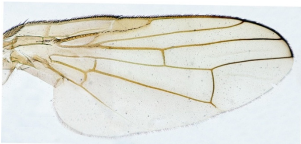
شکل ۲- گونه U. hermonis (اصلی)

گیاه میزبان: لاروهای این گونه در طبق گیاهان CENTAUREA از خانواده مرکبه‌ها زندگی می‌کنند (ریچتر ۱۹۷۰).