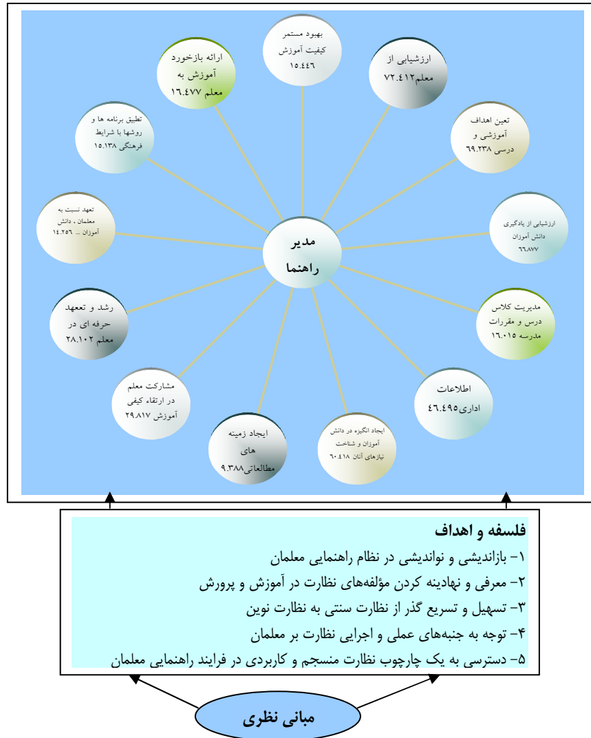
شکل ۲: مدل کارکردهای نظارتی "مدیر راهنما"

یکی از وظایف مهم مدیران، راهنمایی معلمان تازه کار و کم تجربه بود که امروز هم ادامه دارد. مدیران وظیفه دارند نسبت به تحقق هدف‌های آموزشی اهتمام ورزند و در این راستا سهم معلمان بسیار ارزشمند است. از این رو مدیران تا جایی که برایشان مقدور است و صلاحیت و شایستگی آنان اجازه می‌دهد، باید معلمان را راهنمایی نمایند.