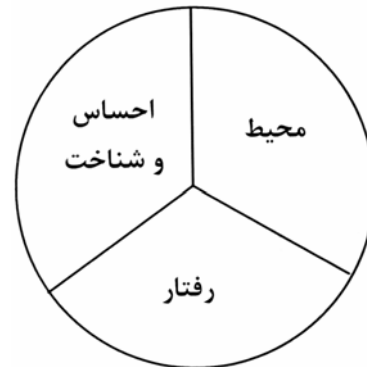
شکل ۱: چرخه تحلیل مصرف کننده (Peter, 2004)