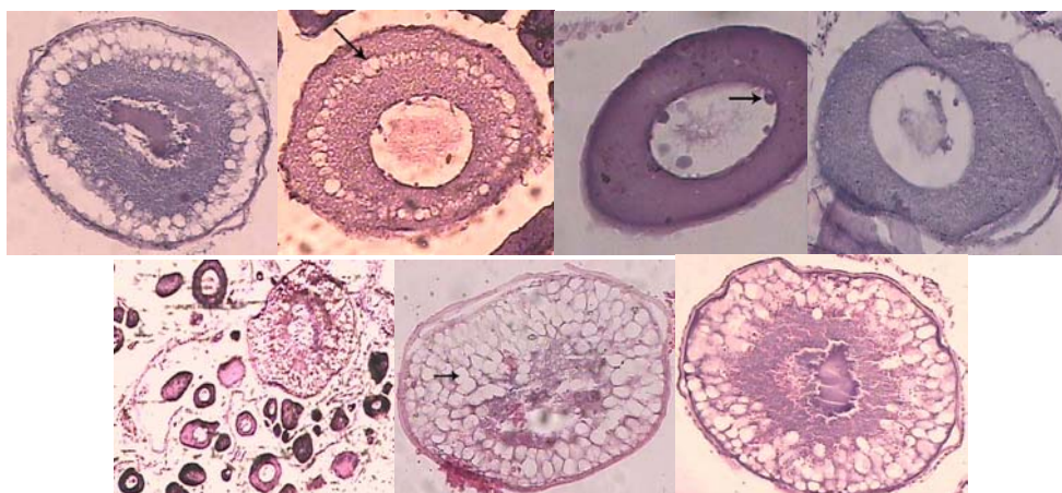
شکل ۱: به ترتیب از بالا سمت راست: مرحله اول (مرحله هستک‌های کروماتینی)، مرحله دوم (مرحله هستک‌های کناری)، مرحله سوم (مرحله وزیکول‌های زرده)، مرحله چهارم (مرحله اول زرده‌سازی)، (مرحله دوم زرده‌سازی)، (مرحله سوم زرده‌سازی)، مرحله ششم (مرحله تخم ریخته)

۵- مرحله سوم زرده‌سازی (Tertiary yolk) دانه‌های زرده حداقل دوسوم فضای سیتوپلاسم را اشغال می‌کنند. اندازه تخمک‌ها ( 979 \mu\text{m} ) و هسته به حداکثر مقدار خود می‌رسند. خطوط روی لایه