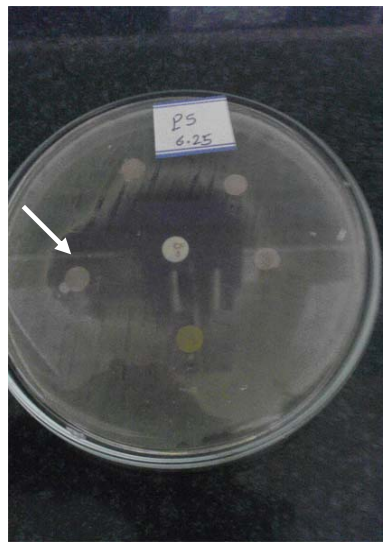
شکل ۱: هاله عدم رشد باکتری سودوموناس