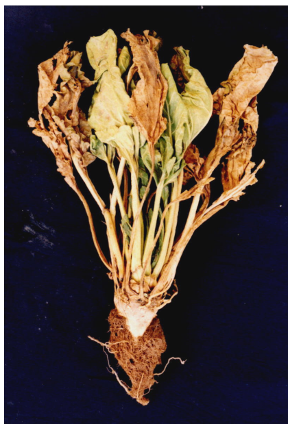
شکل ۳- بوته چغندر قند آلوده به قارچ P. betae و ویروس BNYVV