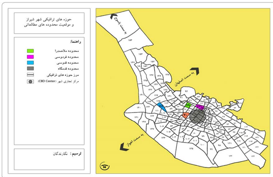
شکل ۲- نقشه حوزه‌های ترافیکی شهر شیراز و موقعیت محدوده‌های مطالعاتی