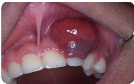
شکل ۲ - ضایعه اگزوفیتیک روی لثه که عرض لثه چسبنده را در بر گرفته و تا عمق وستیبول کشیده شده است

بهداشت دهان بیمار بسیار ضعیف بود. در معاینه داخل دهانی توده برجسته با ابعاد ۳×۳ سانتیمتر در سمت لیپال فک بالا مشاهده شد که از مزایل دندان لترال سمت چپ فک فوقانی تا دیستال آن در همان سمت تا عمق وستیبول گسترش یافته بود و گسترش پالاتالی نداشت. ضایعه تمام عرض لثه چسبنده را در بر گرفته بود. شکل (۲)