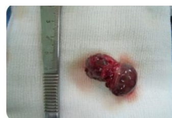
شکل ۴- ابعاد ضایعه پس از برداشت آن