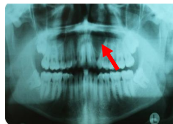
شکل ۳- رادیولوگرافی با حدود واضح (فلش قرمز) در ناحیه دندان لترال و کانین سمت چپ بالابه همراه جابجایی دو دندان مذکور

در بررسی هیستوپاتولوژی، تعداد زیادی سلول ژانت چند هسته‌ای در استرومای پر سلول حاوی سلول‌های مزانشیمال دوکی شکل و گرد و کانون‌های خونریزی مشاهده گردید. سلول‌های ژانت متعدد بوده و انتشار نامنظم داشتند. یگمان هموسیدرین نیز مشاهده شد. بر اساس این یافته‌ها تشخیص ژانت سل گرانولومای مرکزی برای ضایعه گذاشته شد. ژانت سل گرانولومای مرکزی یک ضایعه پرولیفراتیو غیر نئوپلاستیک با اتیولوژی ناشناخته است. بروز آن در فک تحتانی شایعتر از فک فوقانی است. (۱۳) اکثر ضایعاتی که در فک تحتانی رخ می‌دهند، در قدام مولر اول ایجاد شده و غالباً از خط میانی عبور می‌کنند. (۴) لیکن در مورد حاضر ضایعه در فک بالا ایجاد شده بود. ابراهیمی و همکاران یک مورد ژانت سل گرانولومای مرکزی در خلف فک فوقانی سمت راست که از ناحیه دندان انسیزور تا دیستال دومین مولر با بوردر نامنظم کشیده شده بود در یک دختر جوان ۱۵ ساله گزارش نمودند که تورم در سطح لبیال و پالاتال همان سمت مشاهده می‌شد. اما ضایعه تنها به صورت مرکزی بود و به بافت نرم دست اندازی نکرده بود. (۶)