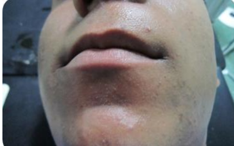
شکل ۱ - تورم منتشر در سمت چپ صورت که باعث محو شدن چین نازولیبیال شده است

صورت طبیعی بود و تغییر رنگی مشاهده نمی‌شد. ناحیه متورم هیچ افزایش دمای موضعی نداشت. در لمس گره‌های لنفی ناحیه هیچ گونه لنفادنوپاتی دیده نشد. بیمار همچنین سابقه‌ی تروما به این ناحیه را ذکر نکرد.