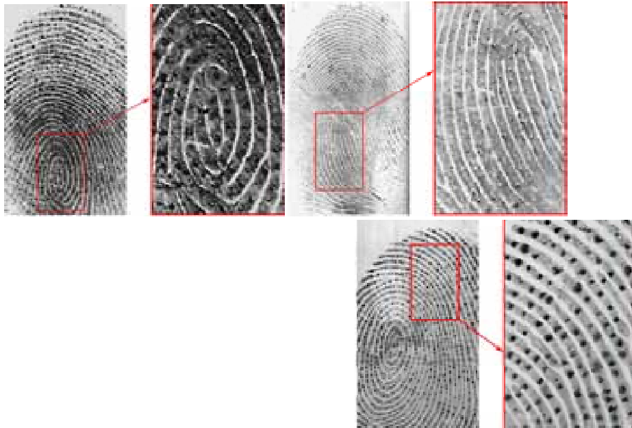
(شکل شماره ۱- اثر انگشت بررسی شده بر روی غشای PVDF از چپ به راست: آنتی کراتین- آنتی کاتپسین- آنتی درمسیدین)