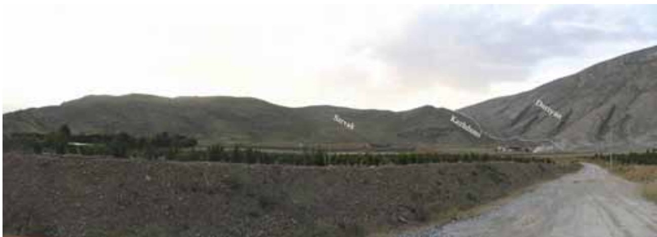
تصویر ۲- ترتیب قرارگیری واحدهای سنگ‌چینه‌ای در کوه نقش رستم