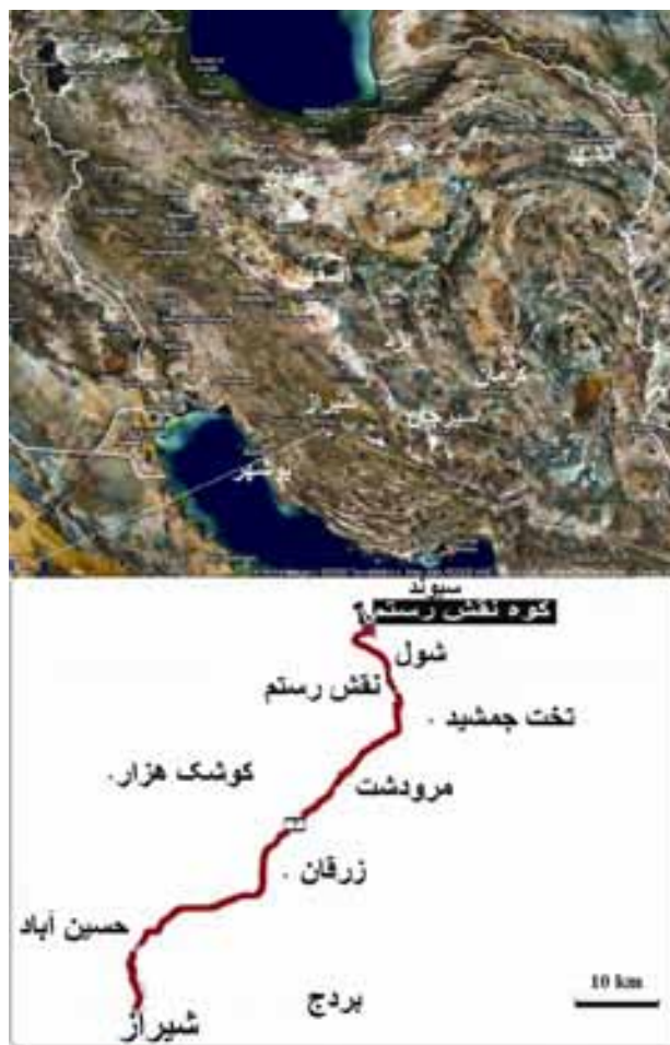
تصویر ۱- نقشه‌ی راه‌های دسترسی به مقطع مورد مطالعه (اقتباس از Garmin 2008)

با پیدایش فرامینفرهای پلاژیک Favusella washitensis (Pl. 1, fig. 13) و Hedbergella trochoidea 1, fig. 13) و فرامینفر بتتیک Hemicyclammina sigali (Pl. 1, fig. 9) همراه با جلبک‌های آهکی Salpingoporella annulata و Salpingoporella muehlbergii (Pl. 1, fig. 1) پایان می‌یابد. این زون به ضخامت ۱۹