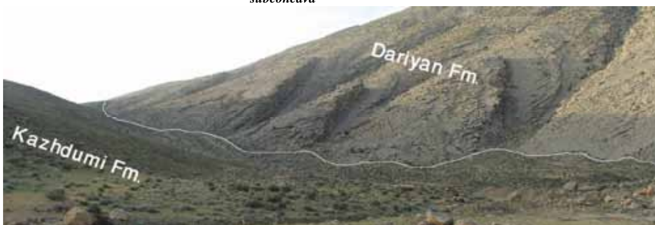
تصویر ۳- مرز سازند داریان و کژدمی در منطقه‌ی مورد مطالعه

(Orbitolina) subconcava مشخص می‌شود. همچنین زون جلبکی Dissocladella deserta (Pl. 1, fig. 3) در این زون وجود دارد.