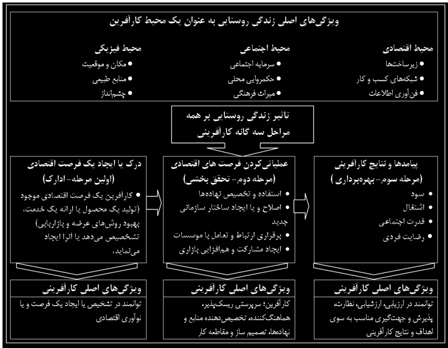
شکل ۱. فرآیندهای کارآفرینی روستایی