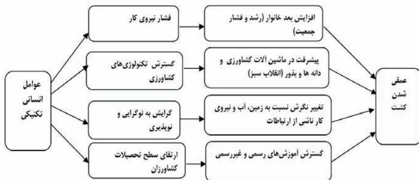
شکل ۲. مدل مفهومی تحقیق