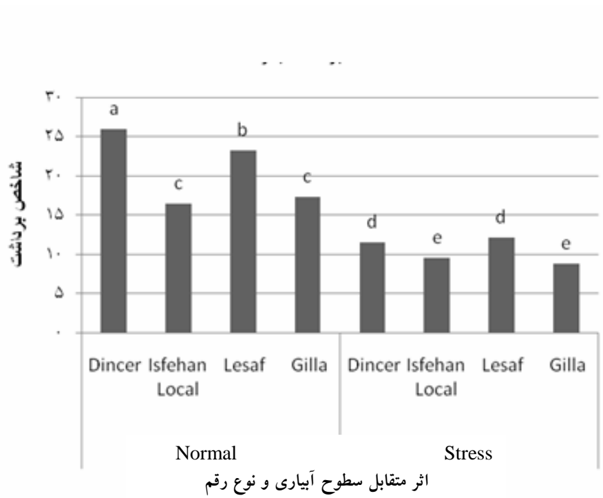
نمودار 1- مقایسه میانگین اثر متقابل سطوح آبیاری و نوع رقم بر شاخص برداشت بذر