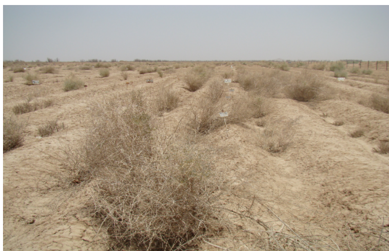
شکل ۱- نمایی از منطقه اجرای طرح

با توجه به نتایج این تحقیق می‌توان بیان داشت که گیاه آتریپلکس موجب کاهش شوری خاک منطقه شده است اما این کاهش فقط تا عمق ۴۰ سانتی‌متری مشهود است. این گیاه با جذب املاح از خاک و ایجاد سایه‌انداز بر روی سطح خاک و به دنبال آن کاهش صعود موئینه می‌تواند این کار انجام دهد. نتایج نشان داد هرس گیاه نتوانسته شوری خاک را کاهش دهد، پس این کار وقت‌گیر و هزینه‌بردار است و پیشنهاد نمی‌شود. با توجه به قابلیت گیاه در تأمین علوفه دام و اثر بیولوژیک آن بر کاهش املاح، کشت این گیاه در مناطق خشک و شور برای استفاده بهتر از اراضی پیشنهاد می‌شود.