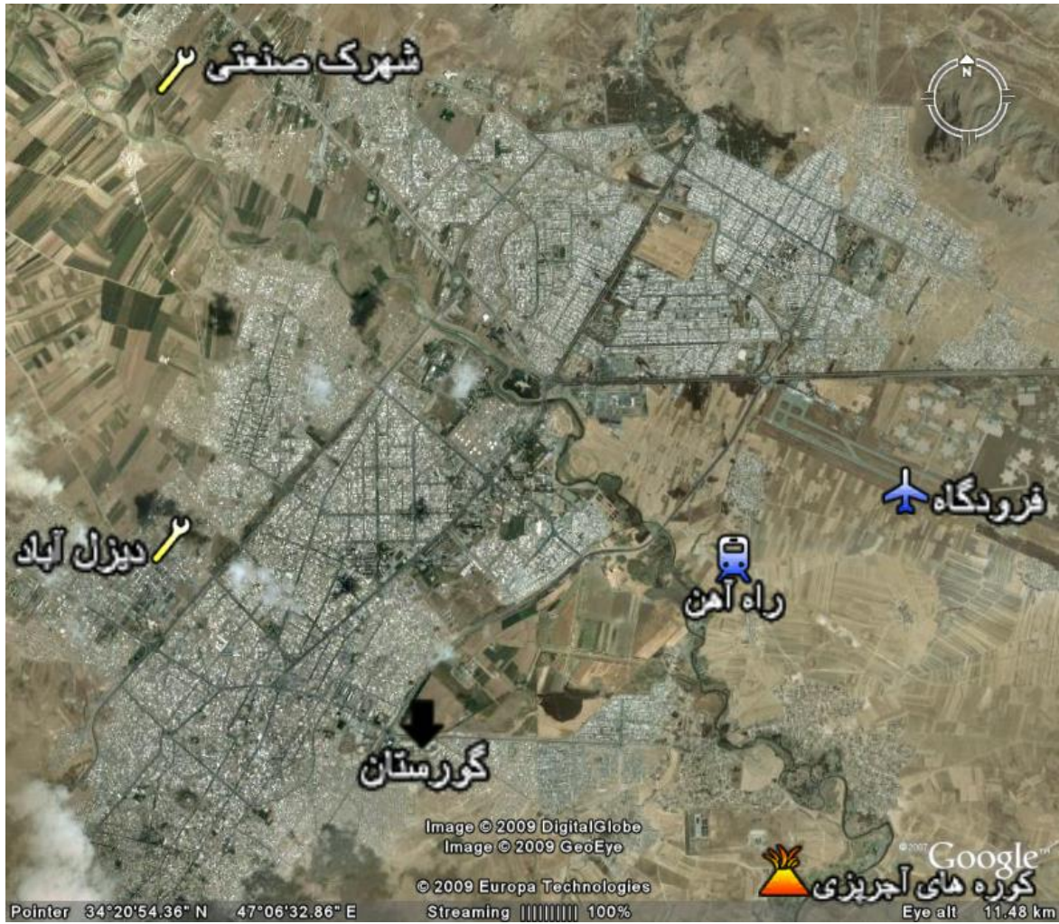
تصویر شماره ۱- موانع انسانی توسعه فیزیکی شهر کرمانشاه