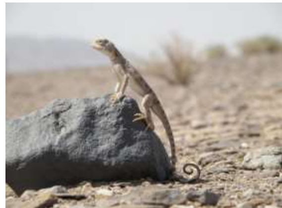
شکل ۲- Phrynocephalus maculatus