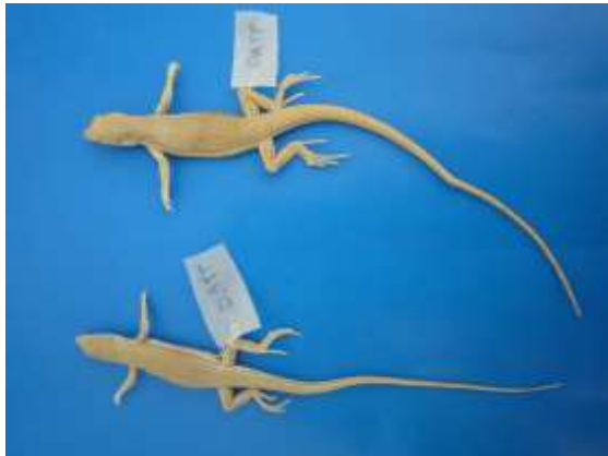
شکل ۹ - Eremias fasciata