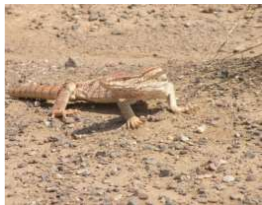
شکل ۱۴ - Varanus griseus