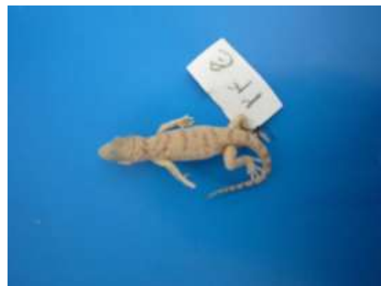
شکل ۸- Bunopus tuberculatus