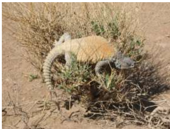
شکل ۱۳ - Saara asmussi