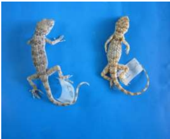
شکل ۵- Cyrtopodion caspium