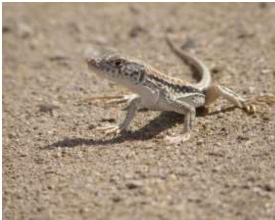
شکل ۱۱ - Eremias pesica