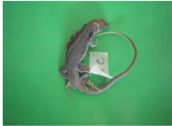
شکل ۱۰ - Eremias velox