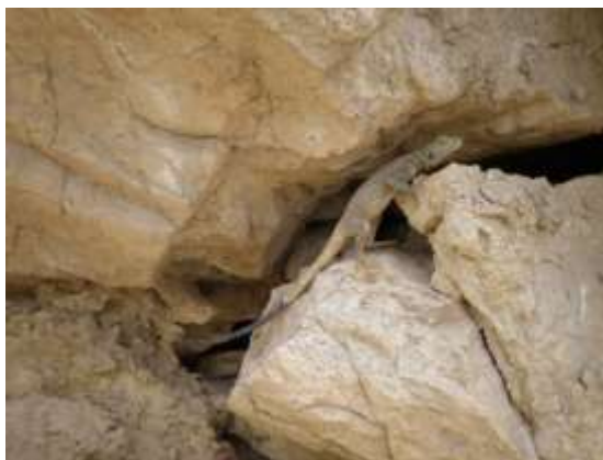
شکل ۱- Ladakia nupta