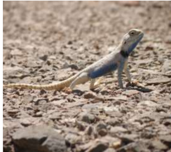
شکل ۴- Trapelus agilis