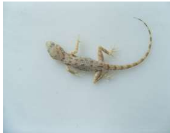
شکل ۶- Cyrtopodion scabrum