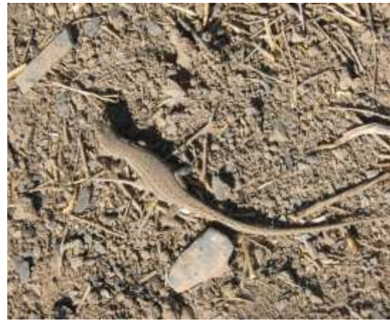
شکل ۱۲ - Mesalina watsonana