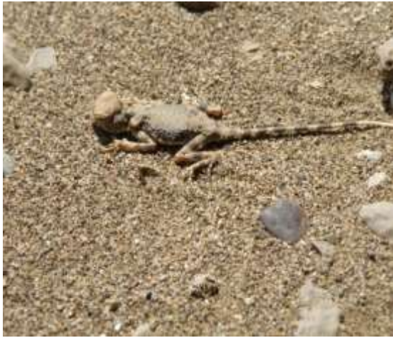
شکل ۳- Phrynocephalus scutellatus