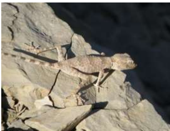
شکل ۷- Agamura persica