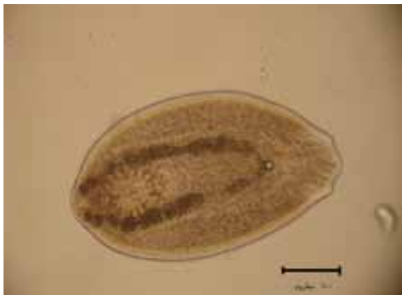
شکل شماره ۱- متاسرکر انگل دیپلوستوموم اسپاتاسئوم بزرگنمایی خط معادل ۱۰۰ میکرومتر \times 300 (تهیه شده توسط نگارنده، تابستان ۱۳۸۷)

در بررسی بعمل آمده از ۱۲۰ عدد ماهی صید شده در مجموع ۷۰ درصد (۸۴ عدد) از ماهیان به انگل دیپلوستوموم اسپاتاسئوم (شکل شماره ۱) آلوده بودند. این بررسی در فصول مختلف سال ۱۳۸۷ انجام گرفته و نتایج حاصله در هر فصل به همراه دامنه و میانگین تعداد انگل مزبور با مشخص کردن انحراف معیار (S.D) در جدول شماره ۱ آورده شده است.