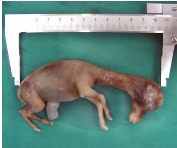
شکل شماره ۱- تعیین سن جنین بر اساس معیار C-RL