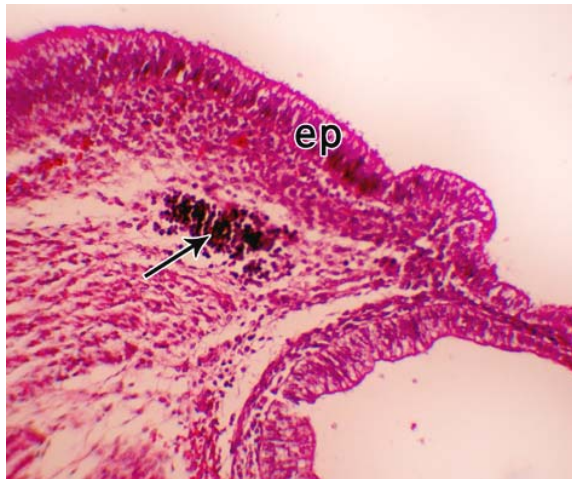
شکل شماره ۲ - جنین با C-RL=30cm ep: اپیتلیوم مخاط، پیکان: ندول لنفوای بزرگنمایی: ۱۵۰ x