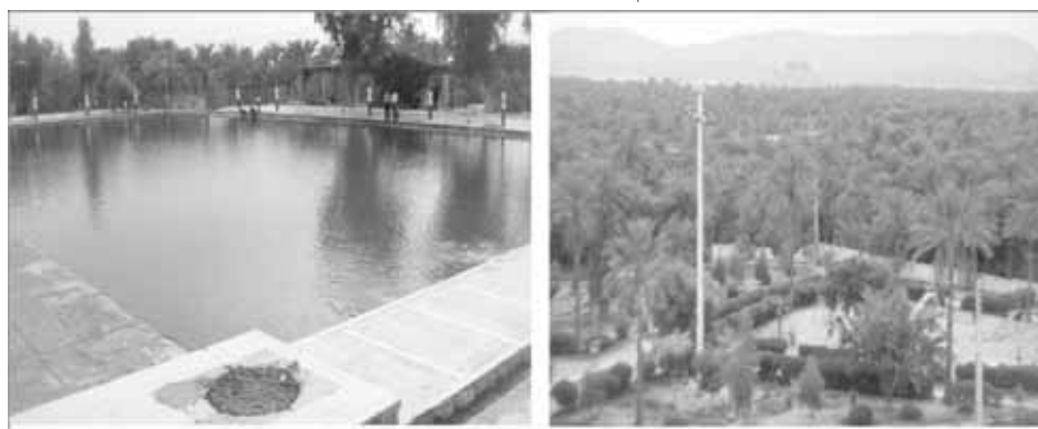
تصاویر شماره ۱ و ۲: درختان نخل و استخر فین

شهر فین با دارا بودن فضای وسیع نخلستان متراکم و خیابان‌های عموماً عاری از بدنه ساختمانی به عنوان یکی از نمونه‌های نادر و واقعی باغ-شهر در سطح کشور می‌باشد. اغلب اماکن شهر در میان نخلستان‌ها احداث شده به طوری که خیابان‌ها و دسترسی‌های شهر به مثابه شبکه‌های ارتباطی یک پارک بزرگ مورد استفاده اهالی شهر قرار دارد. برخورداری فین از شبکه جاده‌ای و ریلی و دارا بودن مجموعه‌ای از پتانسیل‌های گردشگری شامل جاذبه‌های طبیعی (آبشار، نقاط ارتفاعی، نخيلات و ...) جاذبه‌های تاریخی (قلعه فین، آسیاب و...) و فضاهای انسان ساخت (مجموعه استخر، حمام‌ها و...) باعث شده تا فین از سایر نقاط متمایز گردد (تصاویر ۱، ۲). در ادامه مهم‌ترین جاذبه‌های توریستی شهر فین معرفی می‌شود.