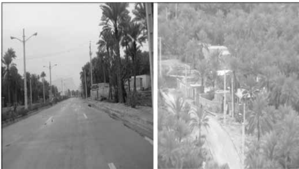
تصاویر شماره ۵ و ۶: نخلستان و باغ شهر فین

قرار گرفته و حتی گاه استخوان‌بندی محورهای اصلی شهر را شکل بخشیده‌اند.