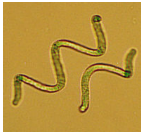
شکل ۱: اسپیرولینا

در ۲۰ سال اخیر اسپیرولینا بطور تجاری تولید شده است و به عنوان غذا مورد استفاده قرار میگیرد. جلبک های تجاری معمولا در استخرهای بزرگ در محیط بیرون تحت شرایط کنترل شده، تولید می شوند و بعضی از شرکت ها بطور مستقیم از تولید دریاچه استفاده می کنند (Belay, 2002). امروزه میزان تولید اسپیرولینا در جهان نزدیک به ۵۷۰۰۰ تن می رسد (FAO, 2006). فروش گسترده در فروشگاههای مواد غذایی و بهداشتی سلامت اسپیرولینا را تضمین کرده است و انسان قرنهایست که از آن استفاده کرده و در مطالعات بسیار گسترده سم شناسی مورد استفاده قرار میگیرد (Belay, 2002).