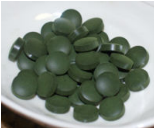
شکل ۲: قرص اسپیرولینا به عنوان مکمل غذایی

اسپیروولینا سیانوباکتر رشته ای میکروسکوپی می باشد و اسم این جلبک از شکل مارپیچی و رشته ای آن مشتق شده است (شکل ۱). گزارشهای متعددی وجود دارد که ۴۰۰ سال قبل آرتک ها در مکزیک از این جلبک ها به عنوان غذا استفاده می کردند. در حال حاضر در کشور چاد در اطراف دریاچه چاد قبیله کانمبو این جلبک را خشک کرده و به عنوان نان مصرف می کنند و به آن Dihe می گویند (Belay, 2002).