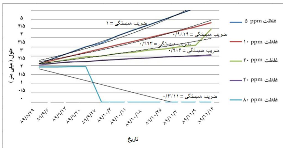
شکل ۱: طول کل بچه ماهیان دلک ماهی کاذب ( Amphiprion ocellaris ) نسبت به تغییرات

تیمار شماره چهار فاقد اختلاف معنی‌دار با تیمار شماره سه است ( P > 0.05 )، اما دارای اختلاف معنی‌دار با