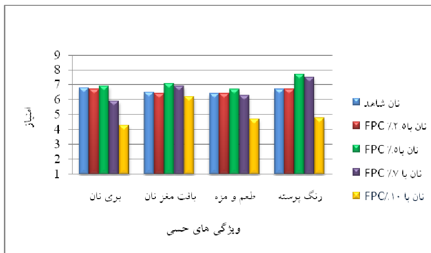
شکل ۱- نمودار ارزیابی حسی نان شاهد و نان های غنی شده با FPC ماهی کپور نقره ای

با انجام آزمون شیمیایی، کنسانتره پروتئین ماهی کپور نقره ای استحصال شده حاوی ۹۱/۵ درصد پروتئین، ۰/۰۳ درصد چربی، ۱/۳ درصد رطوبت و ۳/۳ درصد خاکستر بود. همچنین میزان پراکسید این فرآورده صفر و میزان TVN آن نیز ۱۲ میلی گرم در صد گرم اندازه گیری شد. در شکل (۱) نتایج ارزیابی حسی و بررسی خصوصیات رنگ پوسته، طعم و مزه، بافت مغز و بوی نمونه شاهد و نان های غنی شده با FPC ماهی کپور نقره ای نشان داده شده است. با توجه به شکل (۱) مشاهده می شود که تیمار ۲ (نمونه حاوی ۵ درصد FPC) در تمام ویژگی های حسی بالاترین امتیاز را کسب نمود و پس از آن به ترتیب تیمار ۳ (نمونه حاوی ۷ درصد FPC)، نمونه شاهد، تیمار ۱ (نمونه حاوی ۲/۵ درصد FPC) و تیمار ۴ (نمونه حاوی ۱۰ درصد FPC) قرار داشتند. از نظر ویژگی طعم و مزه و رنگ پوسته نان، نمونه حاوی ۲/۵ درصد FPC، هیچ تفاوتی با نان شاهد نداشت ولی اختلاف نمونه حاوی ۵ درصد FPC با نمونه شاهد معنادار بود ( P < 0.05 ).