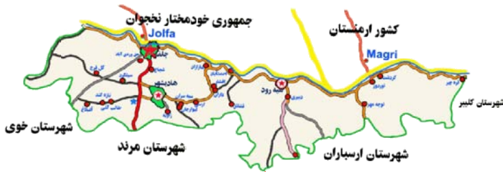
شکل 2 منطقه آزاد ارس (شهرها و کشورهای همجوار)

طرح پایه آمایش استان آذربایجان شرقی معتبرترین و به‌روزترین سند فرادست موجود به‌شمار می‌آید. این طرح مبنای تمام تصمیم‌گیری‌های آمایشی و بخشی استان قرار گرفته است و مأموریت‌ها و وظایف اصلی استان و برنامه‌های اجرایی در قالب برنامه توسعه پنج‌ساله و سالانه استان همسو با تحقق اهداف مصوب این سند صورت می‌گیرد (شورای آمایش سرزمین، 1384).