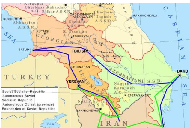
شکل 3 ارتباطات ترانزیتی شمالی ایران از طریق جلفا

مسیر ارتباطی دیگری که در قفقاز جنوبی بسیار مهم است و در جریان حمل و نقل منطقه اهمیت محوری دارد، مسیری است که از گمرک مرزی جلفا شروع می‌شود و در خاک نخجوان و ارمنستان به دو شاخه شرقی و غربی تقسیم می‌شود. شاخه غربی از راه خاک نخجوان، ارمنستان و گرجستان به بندر معروف باتومی در کنار دریای سیاه ختم می‌شود. همچنین این شعبه می‌تواند از راه زمینی در کناره شمالی دریای سیاه به اروپای شرقی و غربی دسترسی داشته باشد. شعبه شرقی این راه پس از عبور از خاک نخجوان و ارمنستان، به باکو در کنار دریای خزر ختم می‌شود. این شعبه از راه زمین می‌تواند به کشور پهناور روسیه دسترسی داشته باشد.