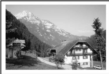
تصویر ۱: چشم اندازی از جنگلهای اسکاندیناوی. چشم انداز رمانتیک از دیدگاه نوربری شولتز