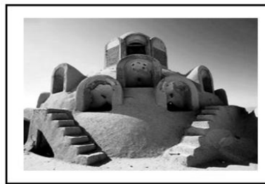
تصویر ۱. هستومندهای از دیدگان نوربری شولتز در محتوای پدیدارشناسانه فضاهای زیستی؛ ماخذ: نگارندگان.