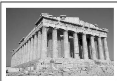
تصویر ۳: چشم انداز ترکیبی از دیدگاه دیدگاه نوربری شولتز

نوربری شولتز، کیفیت محیطهای طبیعی را در رویکردی پدیدار شناسانه با توجه به نور و تغییرات روزانه و فصلی به چشم انداز رمانتیک (مانند جنگلهای اسکاندیناوی)، چشم انداز کیهانی (مانند بیابان)، چشم انداز کلاسیک (مانند فضاهاى زیستای یونانی) و چشم اندازهای ترکیبی (ترکیبی از سه چشم انداز نخستین) تقسیم می کند.