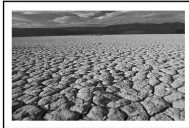
تصویر ۲: چشم اندازی از بیابانهای کویر ایران. چشم انداز کلاسیک از دیدگاه نوربری شولتز

نوربری شولتز، کیفیت محیطهای طبیعی را در رویکردی پدیدار شناسانه با توجه به نور و تغییرات روزانه و فصلی به چشم انداز رمانتیک (مانند جنگلهای اسکاندیناوی)، چشم انداز کیهانی (مانند بیابان)، چشم انداز کلاسیک (مانند فضاهاى زیستای یونانی) و چشم اندازهای ترکیبی (ترکیبی از سه چشم انداز نخستین) تقسیم می کند.