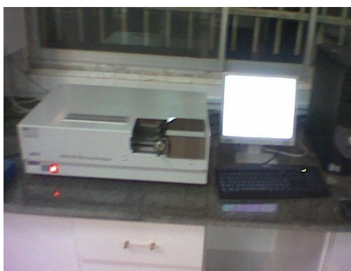
شکل ۲- دستگاه Mercury Analyzer مدل 254 MA

خشک و پودر کردن: برای آنالیز جیوه در دستگاه مرکوری آنالیزر Mercury Analyzer مدل 254 MA، نیاز به خشک کردن نمونه‌های جدا شده از اندام‌ها بود: بنابراین جهت خشک کردن از آن با درجه حرارت بین ۶۵ تا ۹۰ (بر اساس دستورالعمل دستگاه آنالیز) استفاده گردید. بدین صورت که ابتدا نمونه‌های درون بطری‌ها به درون پلت‌های شیشه‌ای منتقل و سپس شیشه‌ها درون آن قرار داده شد. نمونه‌ها باید جهت خشک شدن بهتر به صورت تکه تکه و نازک شده درون پلت‌ها قرار گیرند تا به راحتی و در زمان کوتاه‌تری خشک گردند. نمونه‌ها به مدت ۳۶ تا ۴۸ ساعت (بسته به ضخامت و چربی بافت‌ها) خشک شد. سپس آنها را از آن خارج کرده و در هاون چینی تبدیل به پودر شد، هاون پس از هر بار استفاده برای هر نمونه جهت جلوگیری از ورود مواد یک نمونه به نمونه بعدی به طور کامل شسته شده و پس از خشک شدن برای پودر کردن نمونه بعدی مورد استفاده قرار گرفت. نمونه‌های خشک شده پس از پودر شدن درون قوطی پلاستیکی شماره گذاری شده قرار گرفت و سپس درون خشک کن قرار داده شد تا از ورود رطوبت و جذب آن توسط ذرات پودر شده جلوگیری شود. برای استفاده دستگاه نمونه‌ها باید ریز باشند و قطر ذرات تقریباً یکنواخت