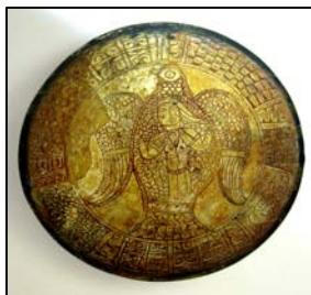
تصویر شماره ۲/ الف