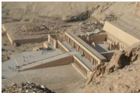
تصویر (7) پرستشگاه «دبر ال - بهاری»

کریستیان دسروش - نوبل کور می‌نویسد: «نام فرعون به معنای خانه بزرگ، نخستین بار در دوره سلطنت هت‌شپ‌سوت به کار رفت و به کاخ اطلاق می‌شد. پس از آن، این واژه برای نامیدن فرمانروای ساکن این خانه بزرگ به کار رفت؛ مفهوم واژه‌هایی مانند کاخ سفید و یا کاخ البیزه امروزی برگرفته از همین نامگذاری می‌باشند.» (دسروش - نوبل کور، 196) دوران فرمانروایی هت‌شپ‌سوت از جمله آرامترین فرمانروایی‌های مصر به شمار می‌رود.