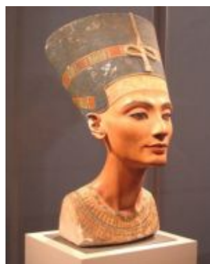
* موزه بریتیش لندن

یکی دیگر از این ملکه‌های قدرتمند، آنخسا (به معنای: دختری که برای آتون زندگی می‌کند) است: دختر سوم آخناتون و نفرتی‌تی، همسر توتانخامون معروف که آرامگاهش کاملاً دست نخورده در نهم نوامبر 1922 به دست هاوارد کارتر، مصرشناس انگلیسی، کشف و باز شد. «اسباب و اثاثیه، پاپيروس‌ها و سنگ‌نوشته‌هایی که در این آرامگاه پیدا شدند، همگی حکایت از عشق بی حد توتانخامون به همسرش دارند و نقش کلیدی این ملکهٔ مصمم و با اراده را در ادارهٔ سرزمین به تصویر کشیده‌اند.» (گرونی، 1997: 107). روی صفحه‌ای از جنس عاج او را می‌بینیم که پیراهنی بلند و پلیسه به تن دارد و دو مار کبرای روی تاجش، که مقابل پیشانی‌اش قرار دارند، سمبل سلطۀ او بر سراسر سرزمین مصر هستند. روی پشتی اریکهٔ سلطنت، او را با چهره‌ای جافتاده‌تر می‌بینیم که تاجی شامل دو شاخ گاو ماده با خورشیدی در وسط و دو پر بلند در دو طرف به سر دارد: پرها نشانهٔ نفس ملکوتی و دو شاخ گاو ماده