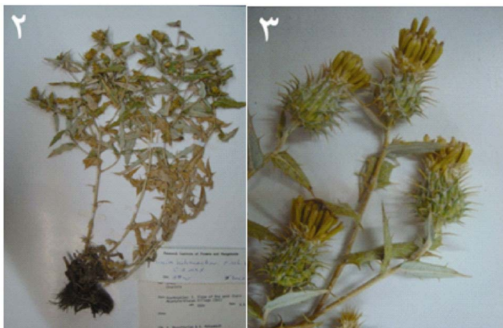
شکل‌های ۲ تا ۳- تصاویر هرباریومی گونه Cousinia hohenackeri Cousinia chlorocephala C.A.Mey. in DC., Prodr. 6: 554 (1838). (Photo 4 & 5, Map 1)