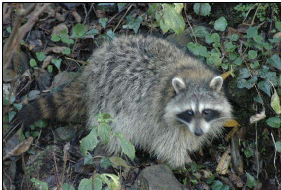
شکل ۱- راکون (بالا: فراشی، ۱۳۸۸، پایین: شریف، ۱۳۸۶)