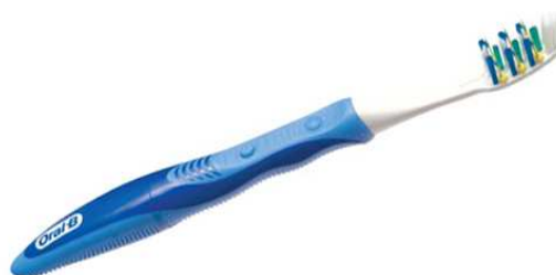
شکل ۲. مسواک Pulsar

در مرحله‌ی بعدی از داوطلب خواسته می‌شد که با مسواکی که به او تحویل داده شده بود، به مدت ۲ دقیقه و به روش Bass مسواک بزند، سپس یک بار دیگر شاخص پلاک فرد محاسبه و ثبت می‌گردید. در انتهای این دور از مطالعه، به منظور اطمینان از صحت شرایط مطالعه مسواک اول از بیمار گرفته می‌شد و مسواک دوم تحویل او می‌گردید و همان فرآیندی که در مورد مسواک اول بیان گردید، برای مسواک دوم و سوم نیز تکرار می‌شد.