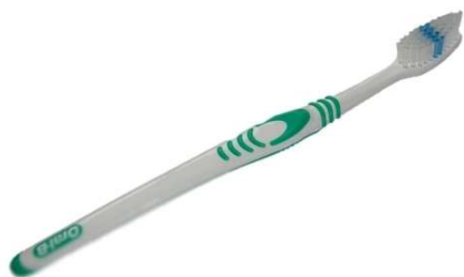
شکل ۳. مسواک Classic

می‌آورند. در محل دسته‌ی این مسواک محل شستی مناسبی که گیر مفیدی ایجاد می‌کند، تعبیه شده است و این امر به کنترل عالی مسواک بسیار کمک می‌نماید (۱۰).