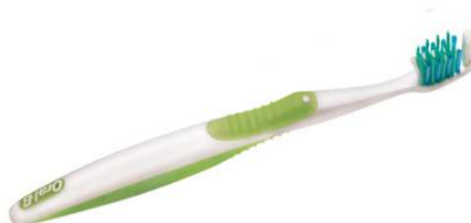
شکل ۱. مسواک Cross-action