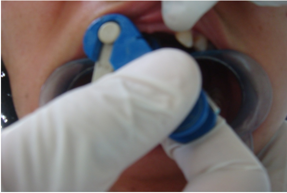
شکل ۲. نحوه ثبت اشباع اکسیژن خون پالپ دندان توسط پروب گوشه

هر بیمار ثبت می‌شد. همین عمل بر روی دندان مجاور ایمپلنت نیز انجام گردید و توسط پروب گوشه اشباع اکسیژن خون پالپ دندان ثبت شد (شکل ۲).