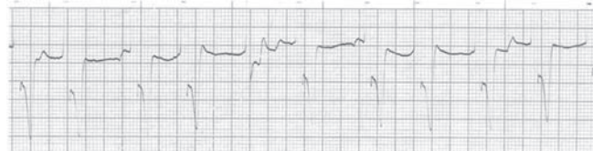
شکل ۲: اسب، برادیکاردی و ریتم فرار بطنی، الکتروکاردیوگرام اخذ شده در اشتقاق قاعده ای راسی با سرعت ۲۵ میلیمتر بر ثانیه در روز دوم.