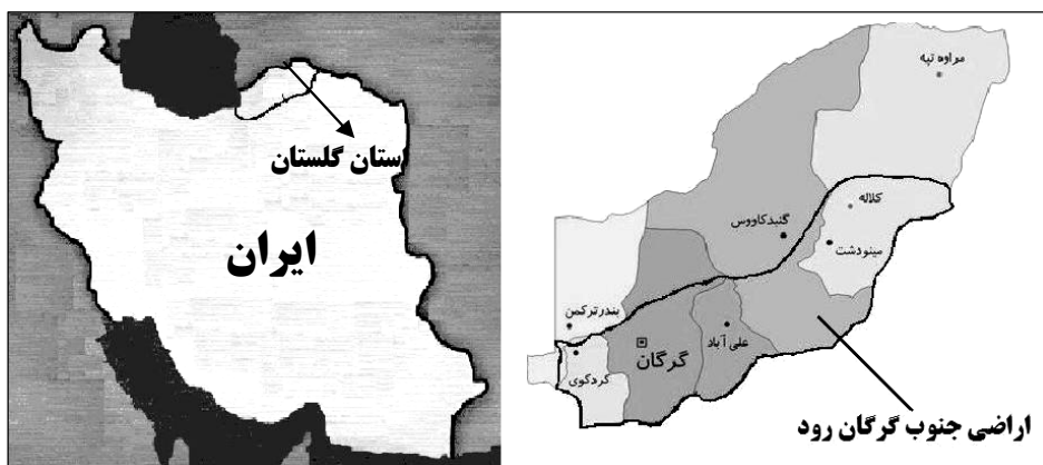
شکل ۱- موقعیت منطقه مورد مطالعه.

اراضی جنوب گرگان‌رود دشتی است به وسعت ۳۳۷۰۰۰ هکتار واقع در استان گلستان که بین طول جغرافیا ۵۳ درجه و ۵۹ دقیقه و ۳۱ ثانیه شرقی و عرض جغرافیایی ۳۶ درجه و ۴۴ دقیقه و ۳۰ ثانیه شمالی قرار دارد. این منطقه از شمال به گرگان‌رود و دیوار اسکندر، از غرب به دریای خزر و از جنوب و شرق به کوه‌های البرز محدود می‌شود. ارتفاع منطقه بین ۲۵-۲۷۰ متر از سطح دریا می‌باشد (شکل ۱).