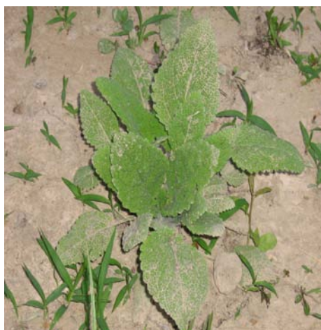
شکل ۲- بوته‌ها در مرحله رزت.