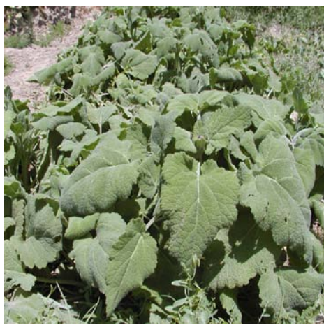
شکل ۴- بوته‌ها در مرحله ساقه‌دهی.