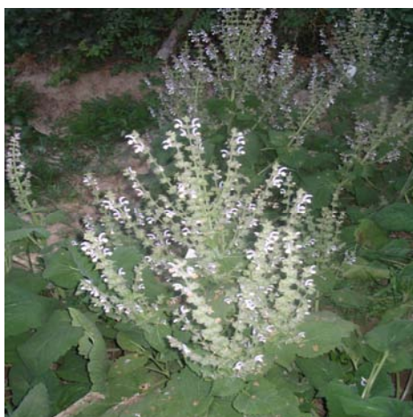
شکل ۵- مرحله گل دهی گیاه مریم گلی کبیر.