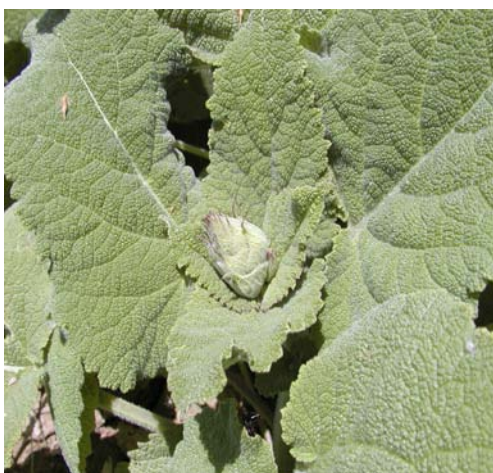
شکل ۳- ابتدای ظهور گل آذین.

کروماتوگرام اسانس گیاه در شکل ۶ آمده است. روستائیان (۱۹۸۲)، برای اولین بار مهم‌ترین ترکیب‌های این گونه را لینالیل استات، لینالول و آلفا ترپینئول گزارش نمودند. میرزا و همکاران (۲۰۰۳) مهم‌ترین ترکیبات اسانس گونه S. mirzayanii را لینالول (۱۹ درصد)، لینالیل استات (۱۲/۹ درصد) و ۱ و ۸ سینئول گزارش نمودند. در اسانس S. limbata جرماکرن D (۲۵/۷ درصد)، لینالیل استات (۱۶/۱ درصد) و لینالول (۱۶/۱ درصد) ترکیب‌های مهم بوده‌اند (باهرنیک و میرزا، ۲۰۰۵).