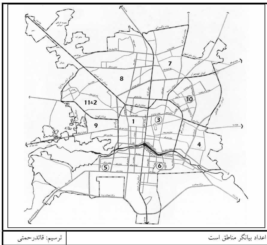
شکل ۱: نقشه منطقه بندی شهرداری اصفهان

صورت کاربری‌های ساخته شده و کاربری‌های باز، تقسیم بندی شده‌اند. داده‌های مربوط به تراکم ساختمانی (ارتفاعی) به صورت وضعیت تراکم ارتفاعی در هر منطقه، تعداد پروانه‌های ساختمانی طی یک دوره شش ساله برحسب تعداد طبقات، از مدیریت نظارت بر اجرای ضوابط شهرسازی شهرداری اصفهان اخذ شده است، که خلاصه سازی و