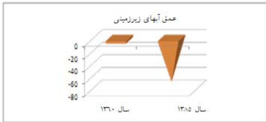
شکل شماره ۲- نمودار تغییر سطح آب زیرزمینی در فاصله سال‌های ۱۳۶۰-۱۳۸۵