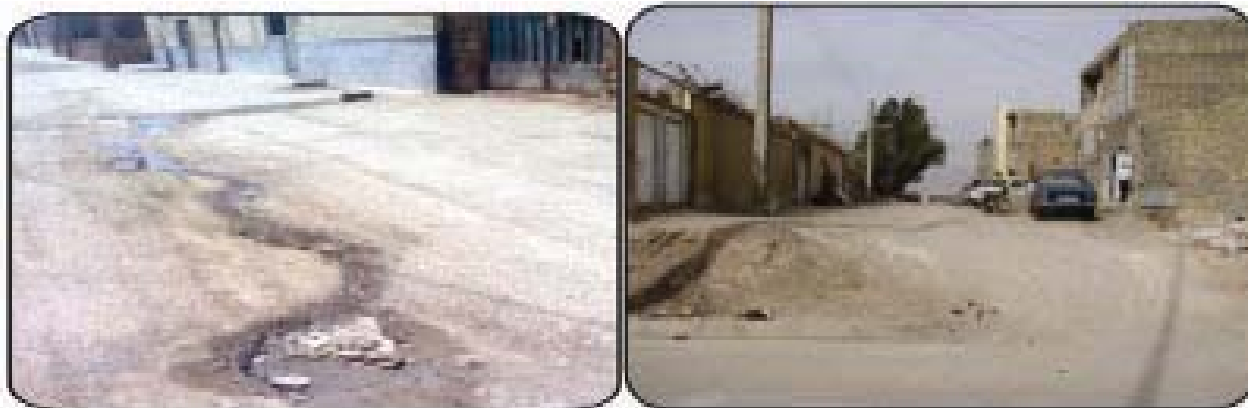
شکل شماره ۳- وضعیت نامناسب دفع فاضلاب و وجود معابر و کوچه‌های خاکی در محله حسن‌آباد شهر یزد (اسفند ۱۳۸۷)